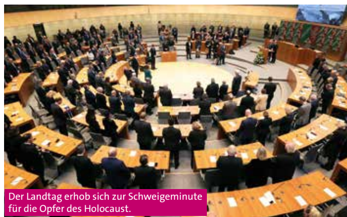
Der Landtag erhob sich zur Schweigeminute für die Opfer des Holocaust.