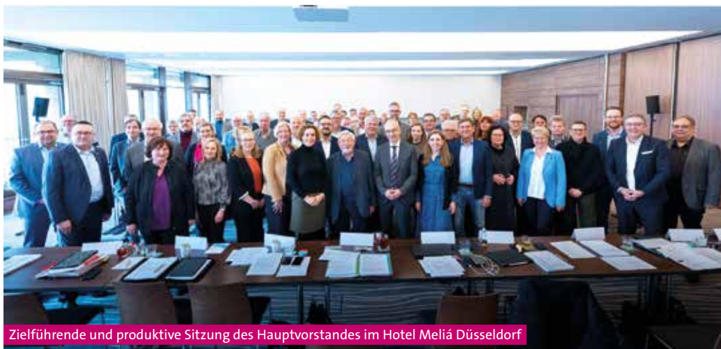
Zielführende und produktive Sitzung des Hauptvorstandes im Hotel Meliá Düsseldorf

Zielführende Vorbereitung des Gewerkschaftstages