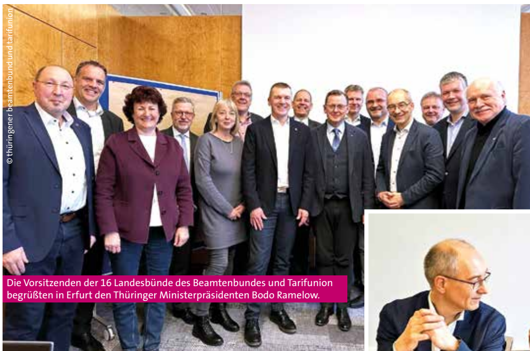
Die Vorsitzenden der 16 Landesbünde des Beamtenbundes und Tarifunion begrüßten in Erfurt den Thüringer Ministerpräsidenten Bodo Ramelow.

Zu ihrer Klausurtagung trafen sich die jeweiligen Vorsitzenden der 16 Landesbünde des dbb beamtenbund und tarifunion am 15. und 16. Februar 2024 in Erfurt. Der Thüringer