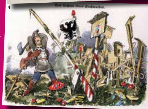
„Fliegende Blätter“ in München (Bd. 6, Nr. 140)