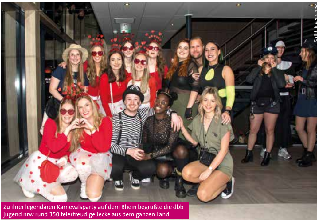
Zu ihrer legendären Karnevalsparty auf dem Rhein begrüßte die dbb jugend nrw rund 350 feierfreudige Jecke aus dem ganzen Land.

Sie kamen aus dem ganzen Land: aus dem Norden der Republik, aus dem Süden, aus dem Osten und aus dem Westen. Rund 350 feierverrückte Mitglieder der dbb jugend nrw trafen sich Anfang Februar bei der magentasten Party des Jahres auf dem Rhein: Alaaf Magenta, der legendären Karnevalsparty