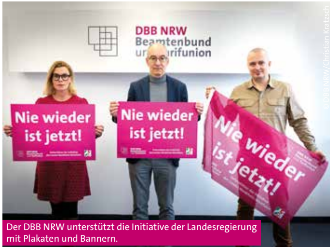
Der DBB NRW unterstützt die Initiative der Landesregierung mit Plakaten und Bannern.

Wir müssen jeden Tag unter Beweis stellen, dass sich Deutschland seiner historischen Verantwortung bewusst ist und entsprechend handelt.