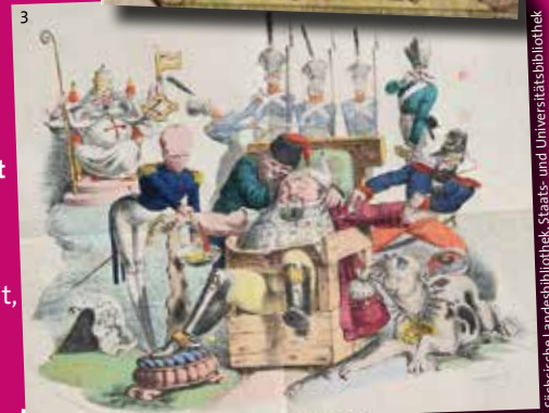
Sächsische Landesbibliothek, Staats- und Universitätsbibliothek