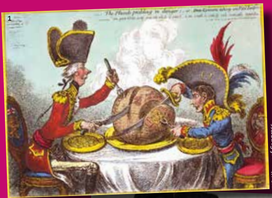
US-Library of Congress