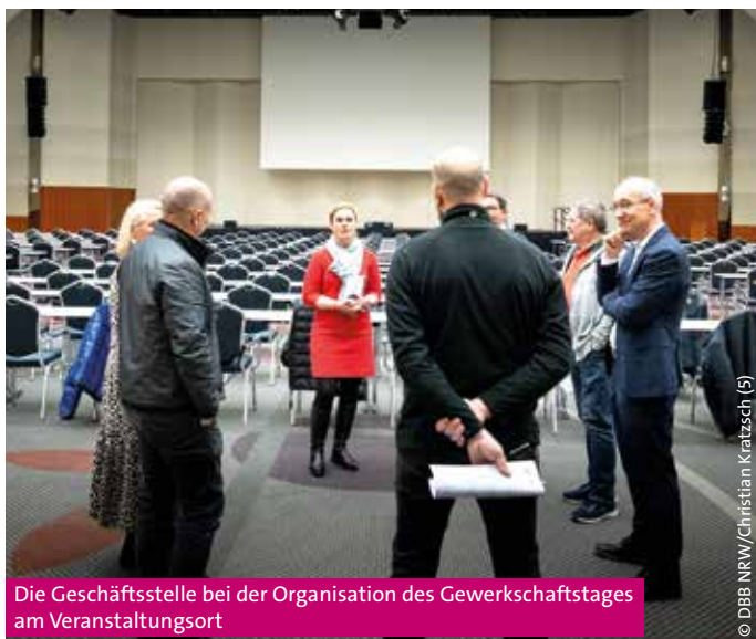
Die Geschäftsstelle bei der Organisation des Gewerkschaftstages am Veranstaltungsort