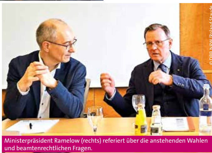
Ministerpräsident Ramelow (rechts) referiert über die anstehenden Wahlen und beamtenrechtlichen Fragen.

war ein Austausch von aktuellen Gesetzgebungen im Beamtenrecht auf Länderbasis. Aufgrund des Föderalismus zeigen sich hier zum Teil große Unterschiede zwischen den einzelnen dbb Landesbünden. Bezüglich des Abstandsgebotes zwischen Grundsicherung und Besoldung sieht Ministerpräsident Ramelow die Einberechnung von Partnereinkommen durchaus kritisch.