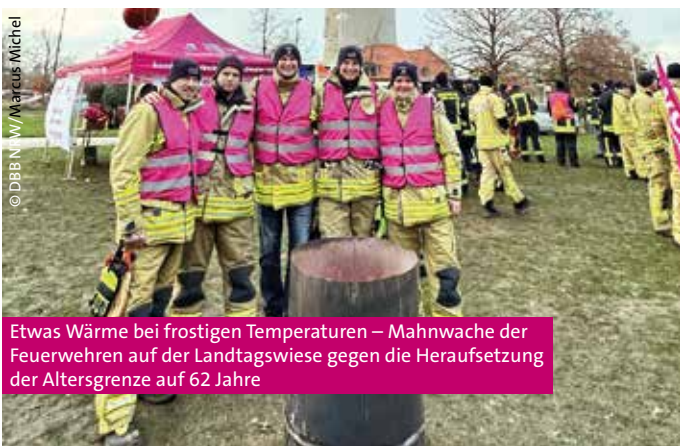
Etwas Wärme bei frostigen Temperaturen – Mahnwache der Feuerwehren auf der Landtagswiese gegen die Heraufsetzung der Altersgrenze auf 62 Jahre

komba nrw, die Kolleginnen und Kollegen massiv frustrieren, die damals vor dem Landtag in den frostigen Temperaturen ausgeharrt hätten, um ihren Protest zu bekunden. Beindruckt von der Großdemonstration der Feuerwehrleute vor dem Landtag, hatte Innenminister Reul noch reumütig Gesprächsbereitschaft signalisiert. Jetzt wird langsam klar, dass das alles nur Show war. Offenbar hat die schwarz-grüne Landesregierung die Feuerwehrleute mit ihren Forderungen umsonst im (Schnee-) Regen stehen gelassen.