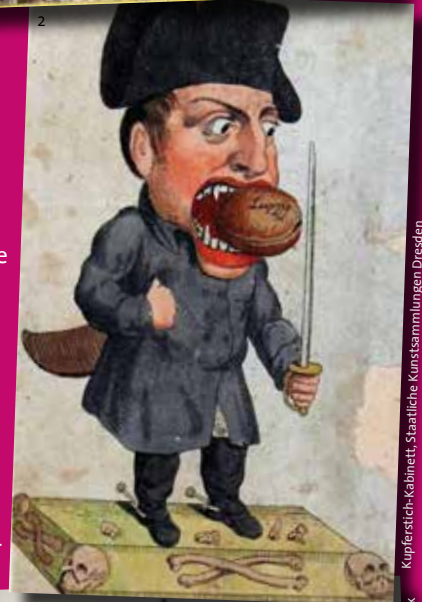
Kupferstich-Kabinett, Staatliche Kunstsammlungen Dresden